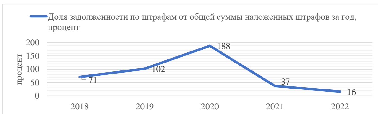
Рисунок 4 – Итоги работы с задолженностями по штрафам за нарушения земельного законодательства в Свердловской области 5

Процент непогашенной задолженности по штрафам за земельные правонарушения с 2018 по 2020 годы был достаточно высоким и, при этом, имел тенденцию к росту. В 2019-2020 годах сумма непогашенной задолженности превышала суммы начисленных штрафов за указанные годы. Коренным образом ситуация изменилась в 2021 году, когда доля задолженности составила 37%, в 2022 году положение стало еще лучше (доля задолженности равнялась 16%) (рисунок 4). Это указывает на смену подхода к взысканию задолженности и увеличение продуктивности предпринимаемых мер.