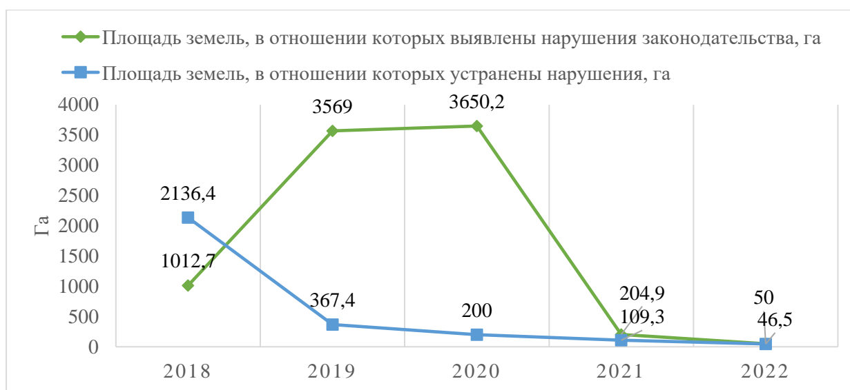
Рисунок 2 - Динамика площадей земельных участков, в отношении которых совершаются земельные правонарушения в Свердловской области, га 3

В 2019 – 2020 годах наблюдались самые высокие значения показателя площади земель, в отношении которых выявлены нарушения (рисунок 2), при этом количество случаев нарушений в эти годы имело тенденцию к снижению (рисунок 1), это свидетельствует о том, что нарушителями являлись правообладатели земельных участков больших площадей. Доля устраненных нарушений (от общего числа выявленных) в 2022 году составила 93%, что свидетельствует о высокой эффективности реализуемых мероприятий.