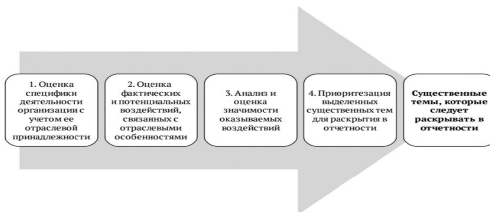
Рисунок 2. Процесс выявления ключевых тем отчета об устойчивом развитии

4. Активное взаимодействие с заинтересованными сторонами (стейкхолдерами) – инвесторами, клиентами, сотрудниками, местными сообществами. Согласно предлагаемому нами подходу, представленному на рисунке 2, организации необходимо начать с проведения стратегического анализа своей деятельности и контекста устойчивого развития, в рамках которого она взаимодействует с заинтересованными сторонами.