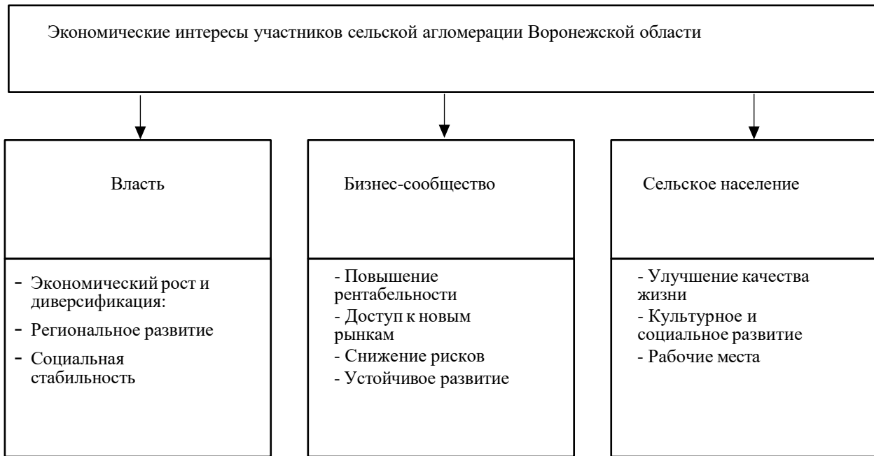
Рисунок 1. Экономические интересы участников сельской агломерации Воронежской области