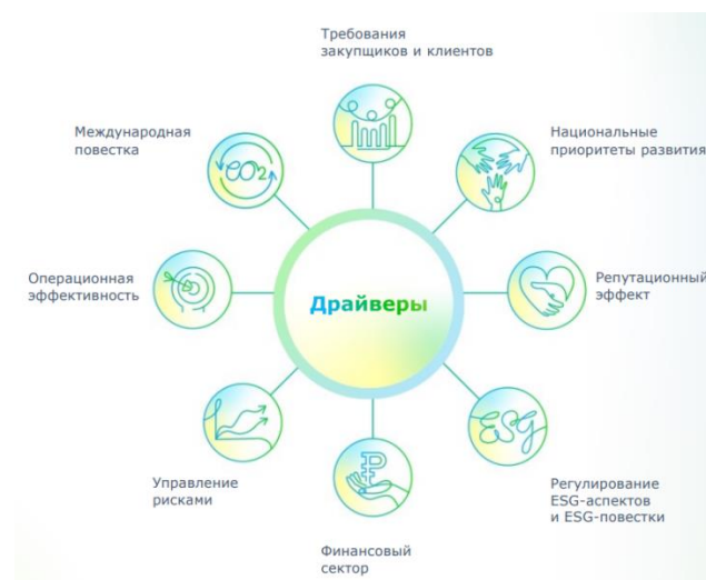
Рисунок 1. Драйверы ESG-повестки

Драйверы современной ESG-повестки показаны на рисунке 1.