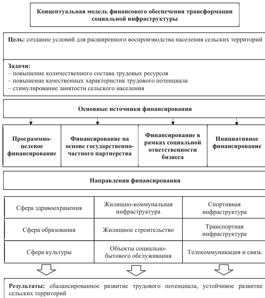
Рисунок 6. Концептуальная модель финансового обеспечения трансформации социальной инфраструктуры Figure 6. Conceptual model of financial support for the transformation of social infrastructure