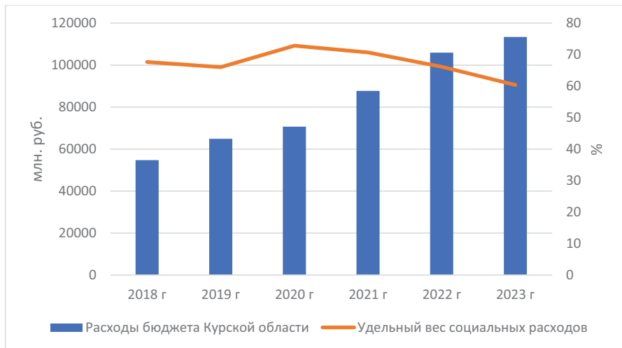
Рисунок 5. Динамика удельного веса социальных расходов в структуре расходов бюджета Курской области Figure 5. Dynamics of the share of social expenditures in the structure of budget expenditures of the Kursk region

Контент-анализ основных нормативно-правовых документов существующей в России институциональной среды регулирования воспроизводственных процессов позволяет сделать вывод о том, что ключевым фактором развития в данном контексте является качество базовых институтов, к которым относятся институты ценностных ориентиров и социальные институты. Сама по себе институциональная среда регулирования воспроизводственных процессов в России в настоящее время достаточно сбалансирована и охватывает все нормативно-правовые документы: от федеральных