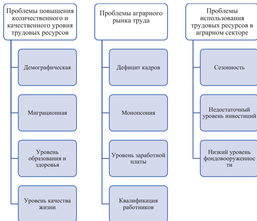
Рисунок 1. Проблемы воспроизводства трудовых ресурсов в аграрном секторе Figure 1. Problems of reproduction of labor resources in the agricultural sector

Высокая мобильность рабочей силы негативным образом сказывается на количественном и качественном составе трудового потенциала сельских территорий. Сократить миграцию можно только за счет трансформации социальной сферы села, поскольку одной из причин территориального перераспределения трудовых ресурсов является высокий уровень жизни и комфортные условия хозяйствования в административных центрах [11]. Важно развивать современную социальную инфраструктуру, удовлетворяющую всем потребностям жителей.