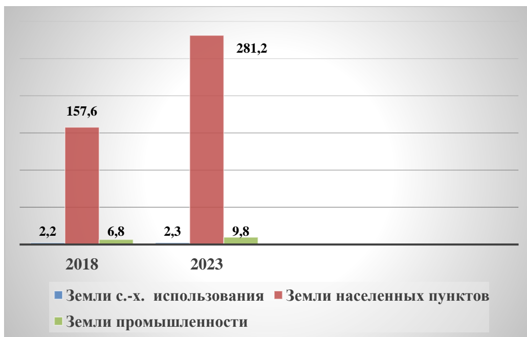
Рисунок 3 - Поступление суммы земельного налога в млн. руб.

оценки увеличилась сумма кадастровой стоимости кв. м по среднему удельному показателю, и следовательно увеличилась сумма поступления налога с 2,2 до 2,3 млн. руб. в 2023 году. Значительно увеличивается площадь земель категории земель населенных пунктов на 2221,5 га и удельный показатель кадастровой стоимости кв. м земель с 566, 3 руб. кв. м 2 до 817,0 руб. Сумма земельного налога в границах населенных пунктов увеличивается с 157, 6 млн. руб. до 281,2 млн. руб. В категории земель промышленности также увеличивается поступление суммы земельного налога с 6,8 млн. руб. до 9,8 млн. руб., в связи с проведением кадастровой оценки и увеличения удельного показателя кадастровой стоимости.