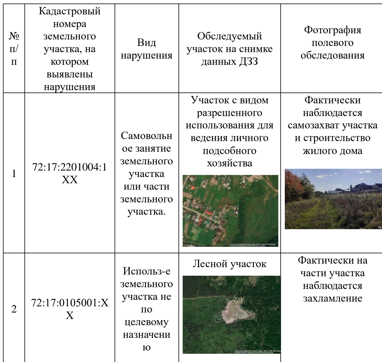
Таблица 13. Данные обследования земельных участков, на которых выявлены признаки нарушений земельного законодательства

Кроме того, на территории Тюменского района были выявлены признаки нарушения земельного законодательства, связанные со складированием бытовых и промышленных отходов в количестве 7 участков. Примеры вышеперечисленных нарушений представлены в таблице 13.