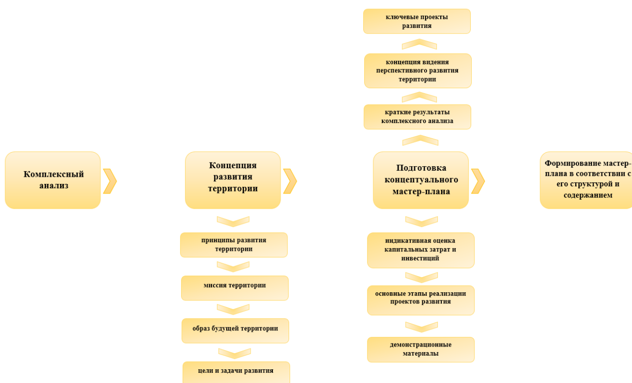
Рисунок 3. Последовательность этапов разработки мастер-плана

Этапы разработки мастер-плана представлены на рисунке 3.