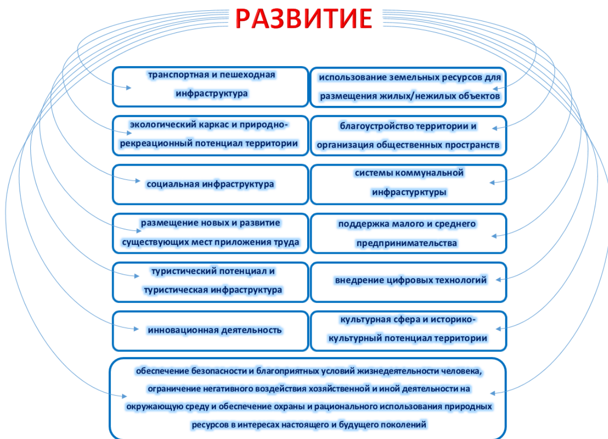
Рисунок 2. Направления развития городской территории по мастер-плану

Программная часть мастер-плана состоит из перечня мероприятий, которые будут реализовываться по каждому из направлений (рисунок 2) для достижения поставленных целей и задач по развитию.