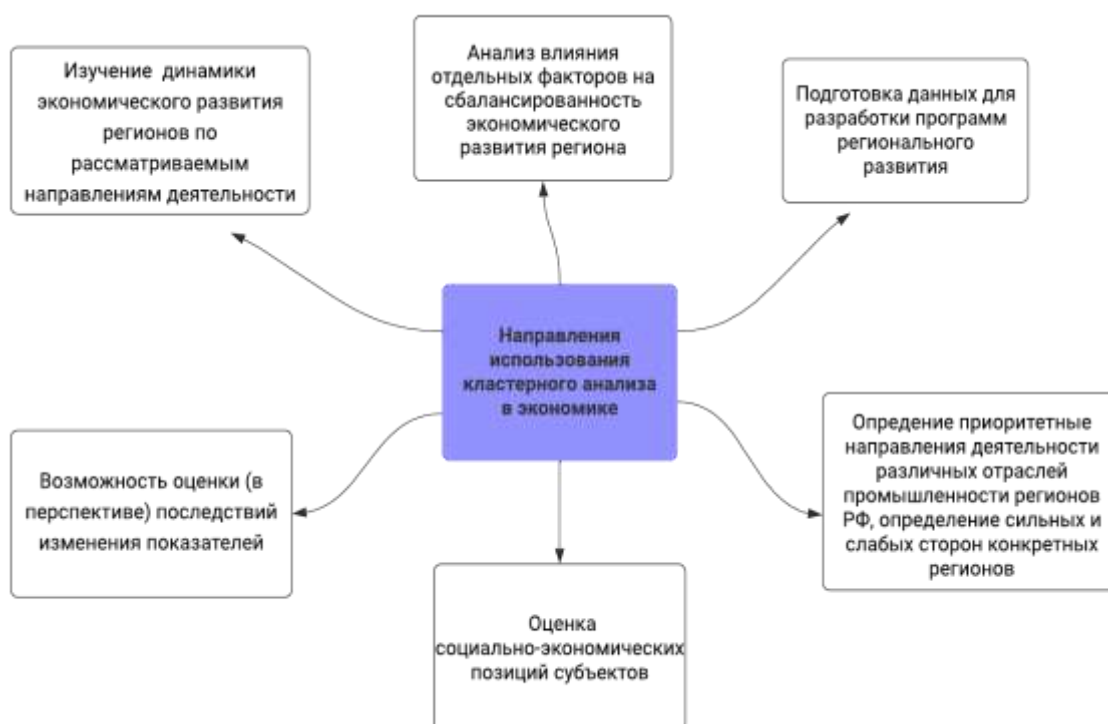
Рисунок 2 Направления использование кластерного анализа в экономике

Для кластеризации в экономике рассматриваются объекты, характеризующихся набором факторных признаков по разным направлениям экономического развития.