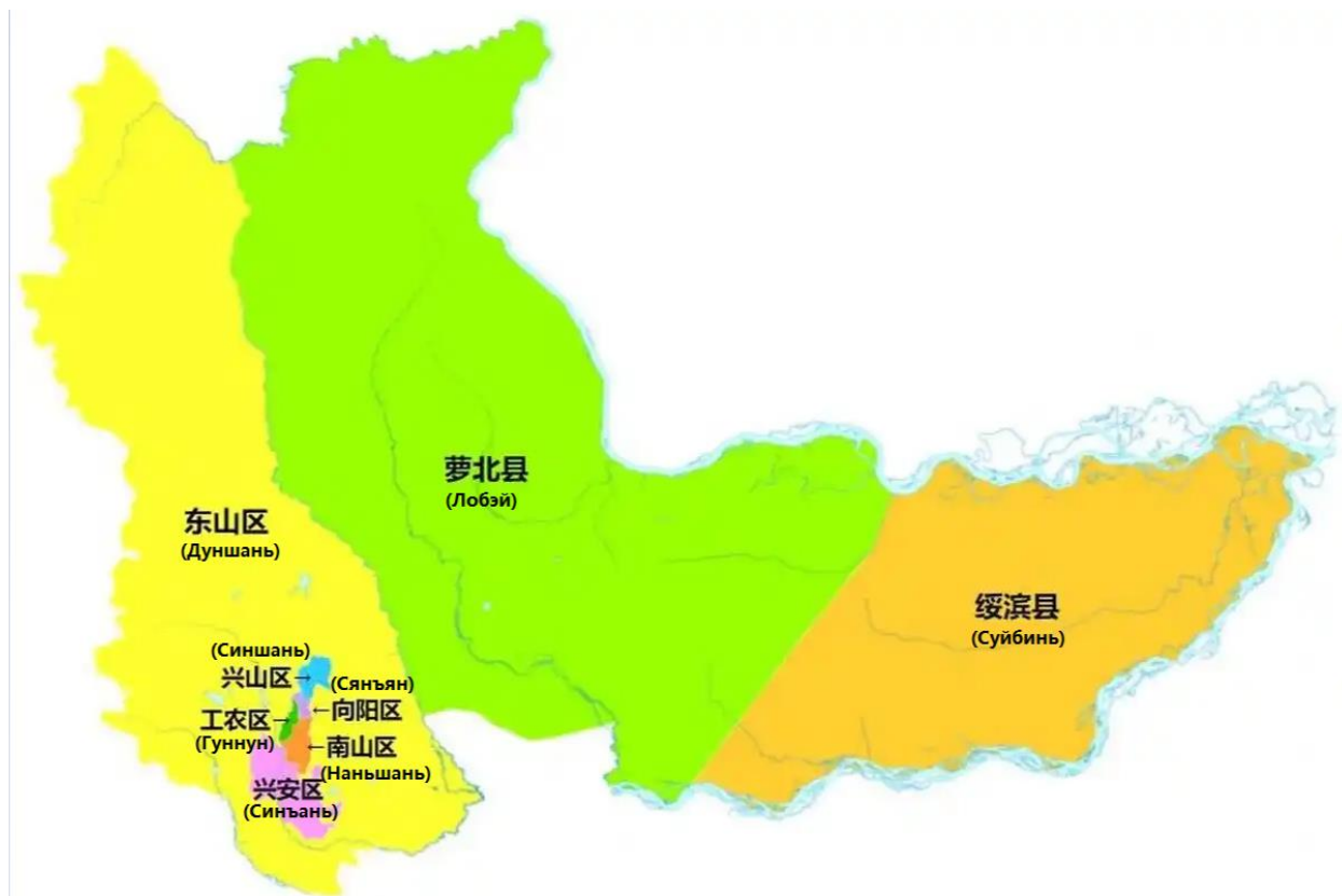
Рисунок 1. Карта городского округа Хэган

известны благодаря другому полезному ископаемому – углю.