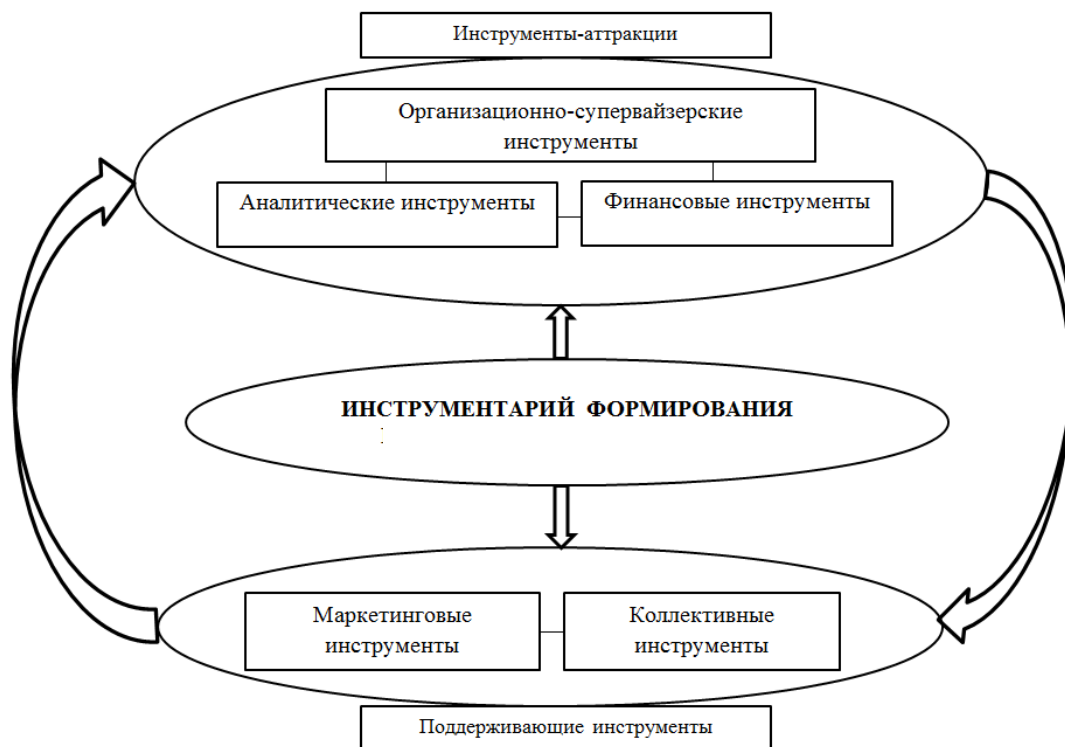
Рисунок 2 – Инструментарий формирования межрегиональной цифровой платформы

одной стороны, позволяет в наиболее полной степени удовлетворить запросы потребителей, а с другой, – обеспечить координацию действий ключевых участников рынка туристских услуг.