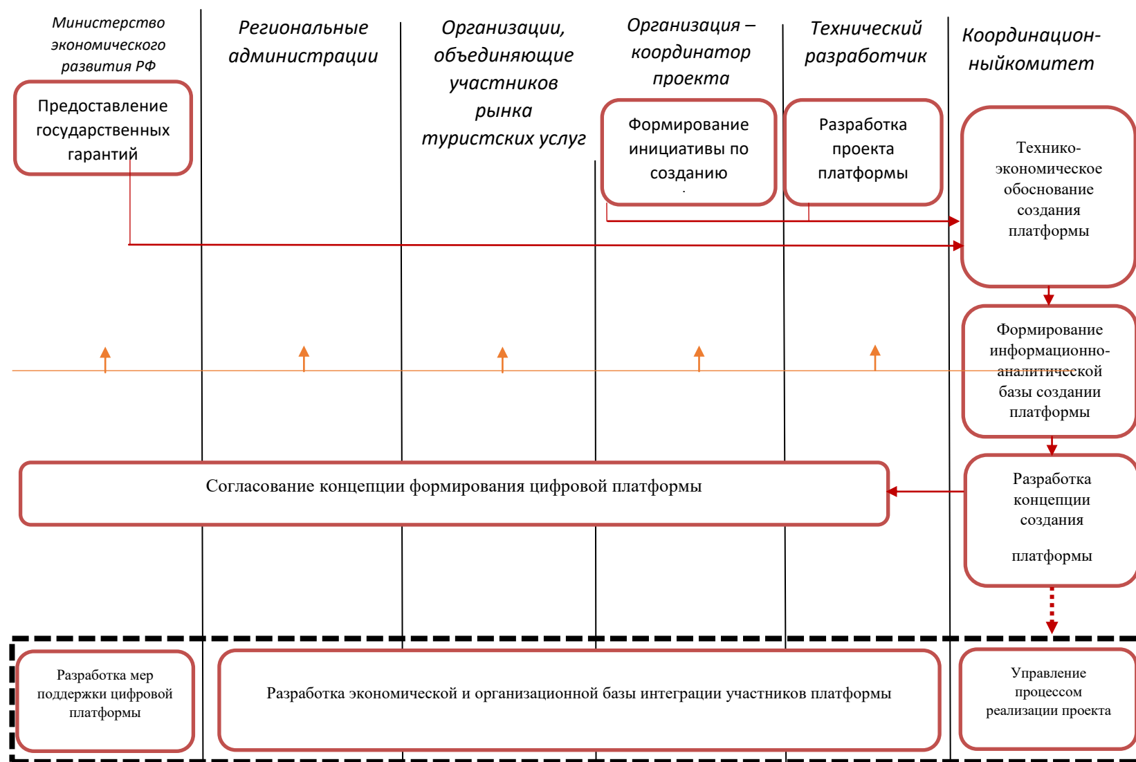
Рис.3 – Организационный механизм формирования межрегиональной туристской платформы [7]