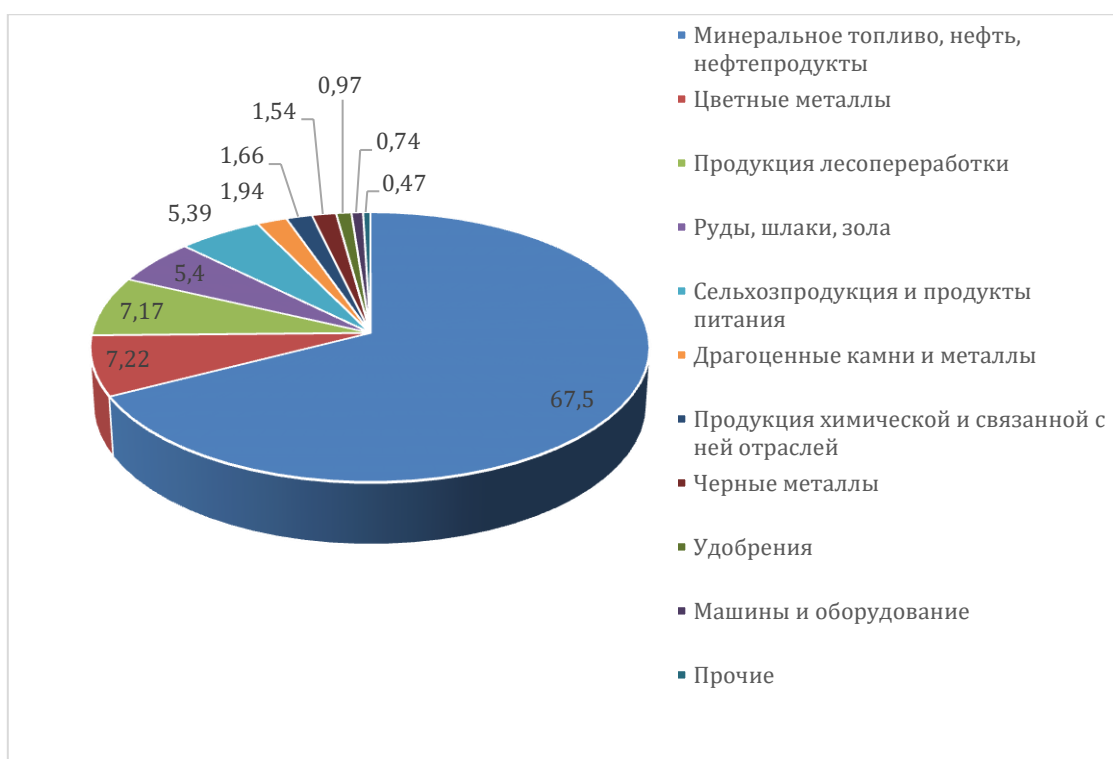
Рисунок 2. Товарная структура российского экспорта в Китай из России в 2021 году (построено автором на основе данных источника [5])

На рисунке 2 представлена структура экспорта российских товаров в Китай.