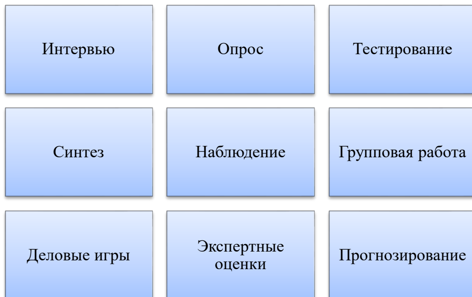
Рисунок 3. Методический инструментарий консультанта

Проводя работу по конкретному вопросу, консультант применяет достаточно обширную методику и методологию. Составляющие методического инструментария внешних специалистов, работающих в образовательных организациях, весьма разнообразны, их можно использовать как комплексно, так и по отдельности (рисунок 3).