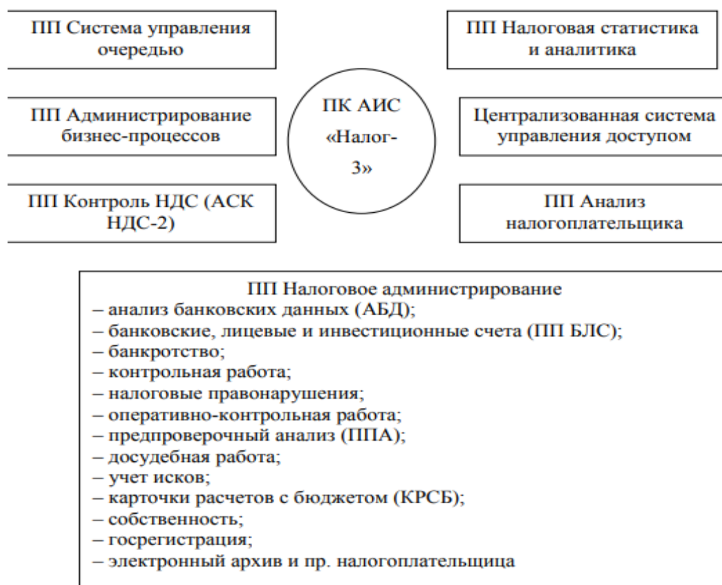
Рисунок 5. Основные модули ПК АИС «Налог-3»

На основе исследования имеющихся систем оптимизации и автоматизации налоговой отчетности для малого среднего и крупного бизнеса, наибольшим функционалом с точки зрения оптимизации взаимодействия с Федеральной налоговой службой Российской Федерации, обладает система АИС «Налог-3». Затраты бюджета на ее разработку составили около 2 млрд. руб.