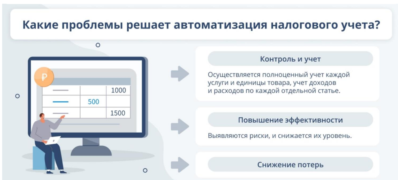
Рисунок 1. Какие проблемы решает автоматизация налогового учета?

Одним из важных и неотъемлемых для любой организации процессов выступает подготовка и сдача отчетности – бухгалтерской, финансовой, налоговой, иной. Такая деятельность носит системный характер, как правило, выполняется профильными специалистами, имеет тесную связь непосредственно с производственными процессами. В конечном итоге, данное направление выступает стратегически важным, и в настоящее время активно реализуется именно с помощью применения современных технологий.