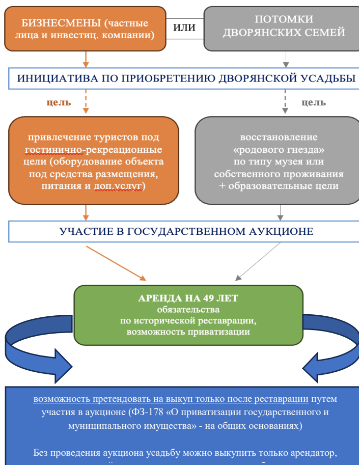
Рис.3. Процесс получения дворянских усадеб под различные нужды

частности, для того, чтобы потенциальному собственнику получить историческое имение, в первую очередь необходимо руководствоваться следующей схемой действий (Рисунок 3):