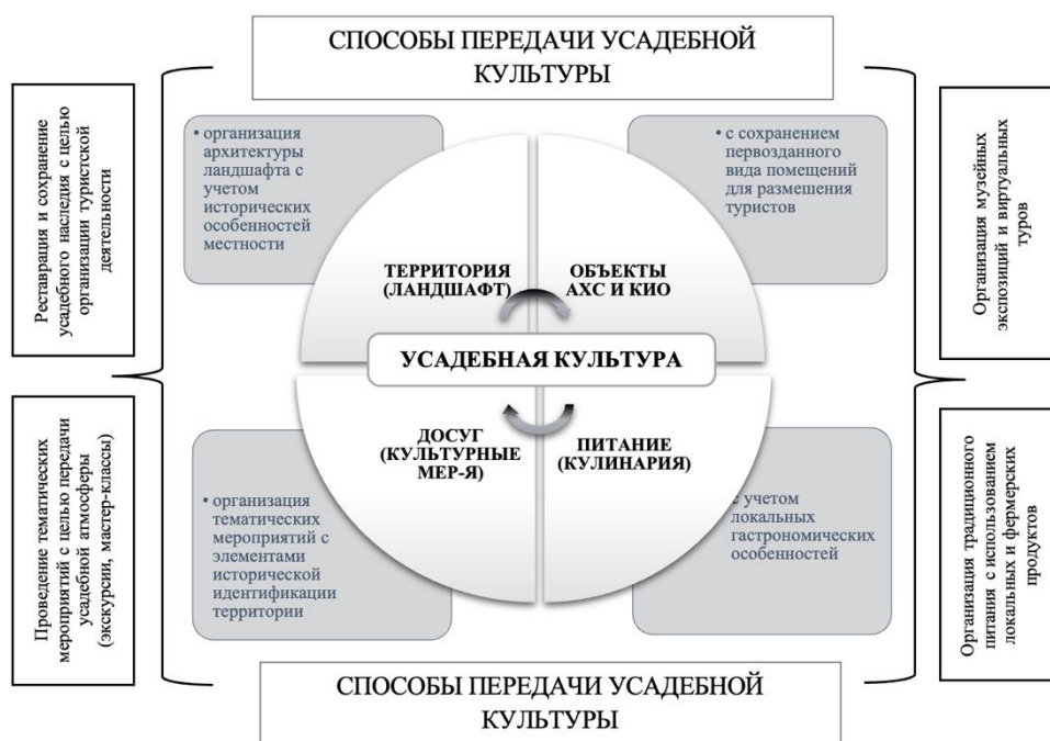
Рис.1. Основные элементы «усадебной культуры» и способы ее передачи

Одним из способов передачи усадебной культуры является сохранение исторического наследия. Многие усадьбы становятся музеями, где можно увидеть оригинальные предметы интерьера, предметы искусства, собрания редких книг и документов. Такие музеи позволяют посетителям погрузиться в атмосферу усадебной жизни прошлых эпох и узнать о традициях и обычаях, присущих этому образу жизни. Кроме того, усадьбы могут проводить различные тематические мероприятия, фестивали и выставки, на которых демонстрируются элементы усадебной культуры. Это могут быть концерты классической музыки, спектакли, мастер-классы по традиционным ремеслам и искусствам, экскурсии по усадебным землям и помещениям.